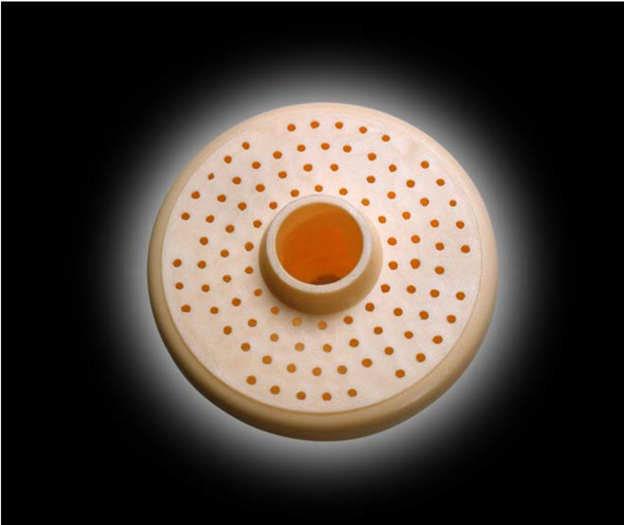
WUNDER, interaktive Dia-Installation, Projektionsgröße ca. 2 x 2 m

Die technische Apparatur ist eine Art Wunschmaschine. Der Betrachter kann auf einem Touchscreen in der Mitte des Raumes zwischen Begriffen wählen, die für menschliche Sehnsüchte stehen. Entsprechend dem aktivierten Wort wird eine Abfolge von Dias mit zugeordneten Gegenständen großformatig auf drei Wandflächen projiziert. Durch die Kombination von sonst nicht assoziierten Bildern und Begriffen ergeben sich neue Zusammenhänge; eine andere Sicht auf deren Sinn und Inhalt wird möglich. Der Auswahlprozess erfordert die aktive, spielerische Teilnahme des Betrachters.