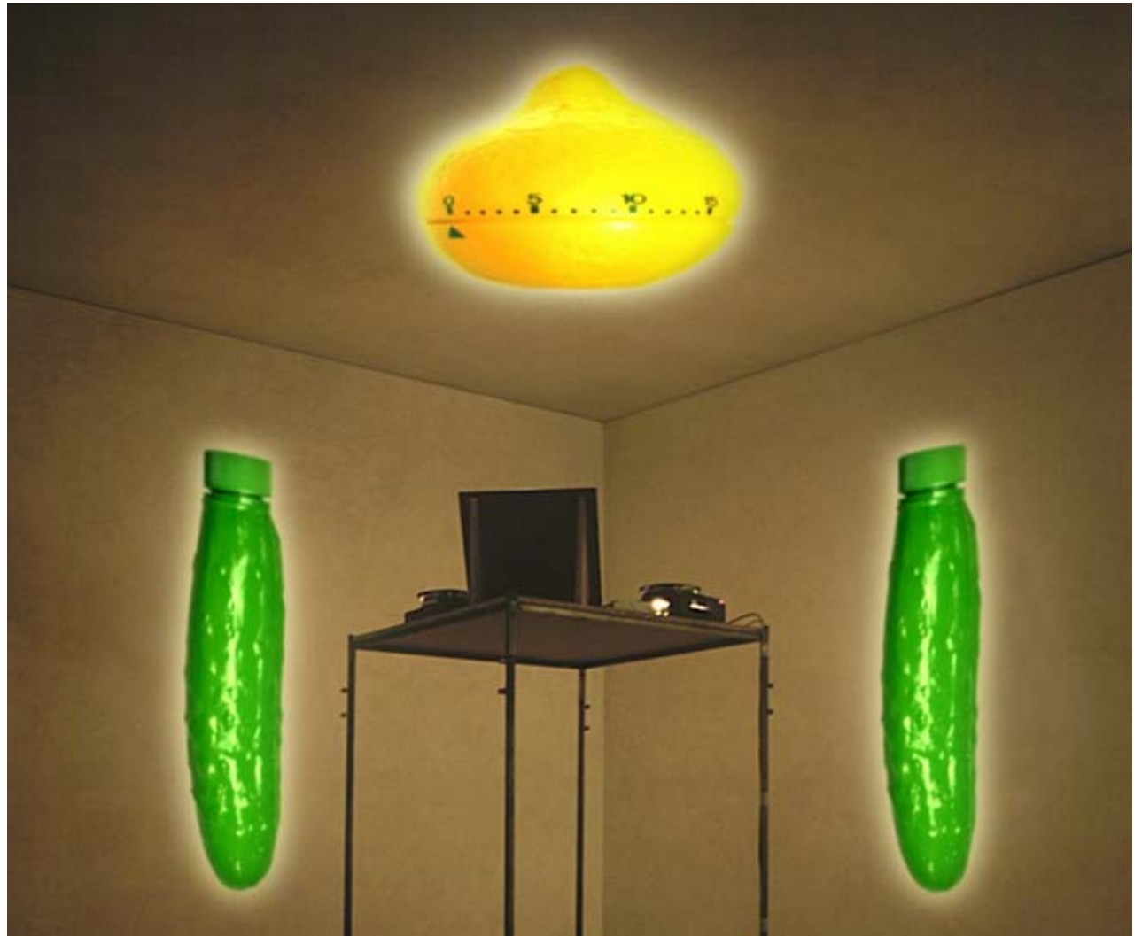
WUNDER, interaktive Dia-Installation, Installationsansicht Galleria d'Arte Moderna e Contemporanea Bergamo, Italien, 1997